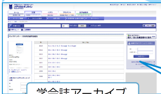
学会誌アーカイブ

学会誌無料閲覧サービスをお申込みいただきありがとうございます。 閲覧方法(手順)について、ご説明させていただきます。